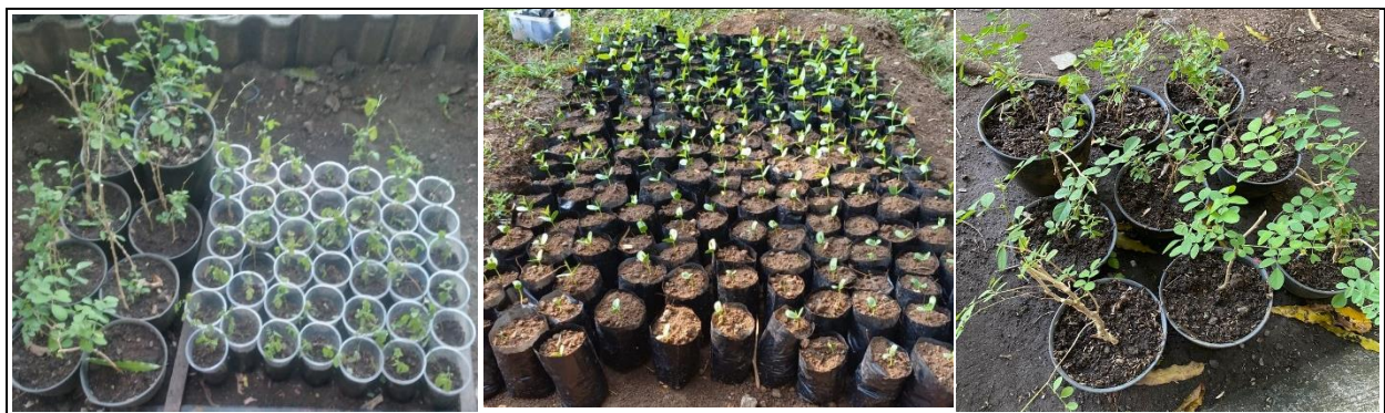
Gambar 1. Pembibitan tanaman telang

Hasil dari kegiatan pemberdayaan Kelompok Wanita Tani (KWT) dalam budidaya bunga telang untuk produk wedang telang di Desa Kalisegoro, Gunungpati, Semarang, dapat mencakup beberapa aspek yang menunjukkan dampak positif dan tantangan yang dihadapi selama program tersebut. Hasil untuk pengabdian pelatihan dan peningkatan kapasitas, pada pelaksanaan pelatihan tentang budidaya bunga telang dilakukan secara berkala dengan fokus pada teknik penanaman, perawatan, dan panen yang tepat. Peserta dari KWT menunjukkan peningkatan pengetahuan dan keterampilan dalam budidaya bunga telang. Hal ini terlihat dari kemampuan mereka untuk mengelola lahan secara efektif dan memproduksi bunga telang berkualitas.