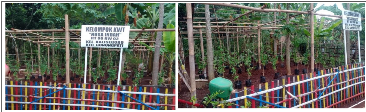
Gambar 2. Budidaya Bunga Telang

KWT telah berhasil menanam, merawat dengan penyiraman dan membesarkan tanaman telang tersebut. Kelompok tani telah berhasil membuat lanjaran sultur untuk tempat merambat tanaman telang. Hal ini menunjukkan bahwa KWT telah memiliki pemahaman yang kuat tentang teknik budidaya tanaman telang dan kemampuan untuk menerapkan keterampilan ini secara praktis. Lanjaran sultur juga penting untuk mendukung pertumbuhan tanaman secara optimal, karena bunga telang adalah tanaman merambat yang membutuhkan struktur untuk tumbuh dengan baik. Dengan keberhasilan ini, KWT berada di jalur yang tepat untuk meningkatkan produktivitas dan kualitas panen, yang tentunya berkontribusi pada pengembangan produk wedang telang serta memperkuat ekonomi lokal.