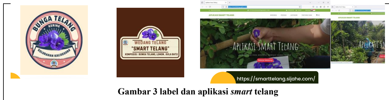
Gambar 3 label dan aplikasi smart telang

Peningkatan hasil produksi bunga telang setelah pelatihan dan pendampingan intensif, KWT mampu meningkatkan produktivitas tanaman bunga telang. Dibandingkan sebelum program, hasil panen meningkat, baik dari segi kuantitas maupun kualitas. Hal ini dikarenakan penerapan teknik budidaya yang lebih efisien dan penanganan kendala yang tepat. Pengembangan produk wedang telang yaitu salah satu inovasi utama dari program ini adalah pengolahan bunga telang menjadi wedang telang. KWT berhasil memproduksi wedang telang dengan metode yang sederhana namun higienis. Produk ini tidak hanya menjadi minuman kesehatan tetapi juga memiliki nilai jual yang cukup tinggi di pasar lokal. Pemasaran dan distribusi produk karena tuntutan selain memproduksi wedang telang, program juga memberikan pelatihan pemasaran kepada KWT seperti pada jurnal pengabdian sebelumnya bahwa upaya pelibatan kaum perempuan secara langsung dalam usaha-usaha peningkatan hasil pertanian, seperti menjadi bagian dari motivasi dalam adopsi dan pengenalan teknologi tani. Tujuan pengabdian sebelumnya untuk memperkenalkan metoda perkebangan biakan bunga telang dan pengolahannya menjadi minuman. Metoda yang digunakan adalah metoda partisipasi aktif, penyuluhan, diskusi, demonstrasi, praktik, dan konsultasi. Kegiatan bermanfaat untuk memperbaiki budidaya bunga telang dan masyarakat memahami proses pengolahan minuman bunga telang yang higienis (Purwandhani et al., 2020).